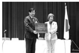
▲文部科学大臣より選定証書を受領

日本・中国・韓国の3カ国において選ばれた都市が、一年間を通じてさまざまな文化芸術イベントや文化交流を実施する事業です。EU加盟国による「欧州文化首都」をモデルに、東アジアの相互理解や連帯感の形成、多様な文化の国際発信を目的として、2014年にスタートしました。10年の節目となる今年は静岡県、成都市、梅州市、全州市が選定されています。