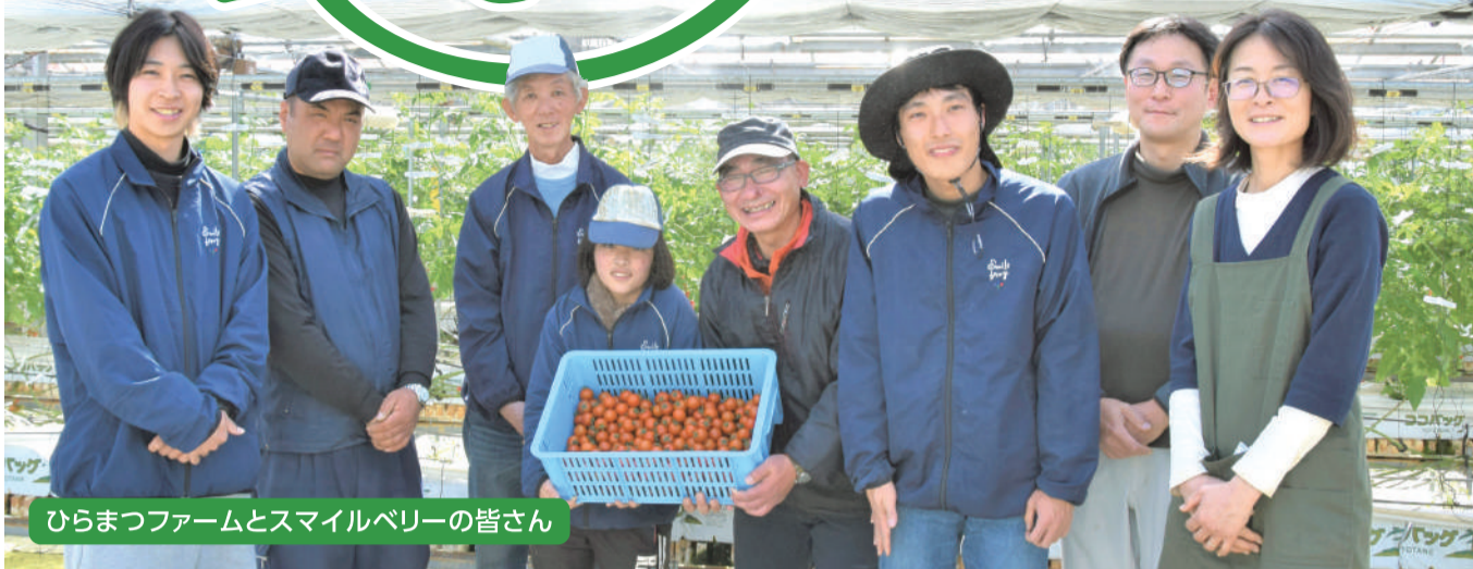
ひらまつファームとスマイルベリーの皆さん