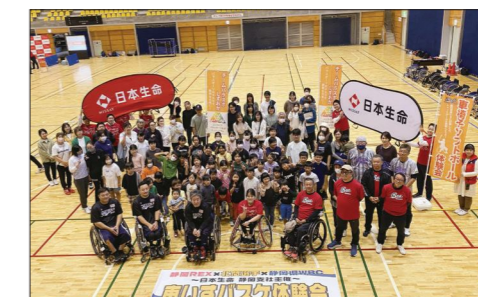
車いすバスケットボール体験会 (日本生命保険相互会社)