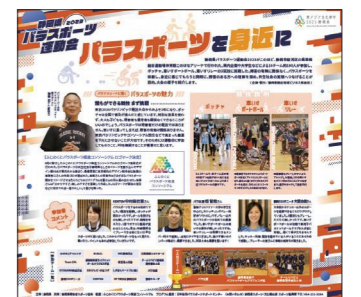
メディア広告 (令和5年11月18日静岡新聞掲載)