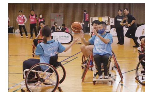
静岡県パラスポーツ運動会(静岡県)