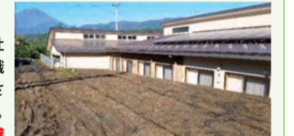
▲施設1階部分を覆う程の土砂が流出

小山町 2019年10月 台風19号による土砂崩れにより社会福祉施設に土砂が流入したが、職員が利用者を安全な2階に避難させ、人的被害を防ぐことができた。施設は事前に避難計画を作成し、避難訓練にも参加していた。