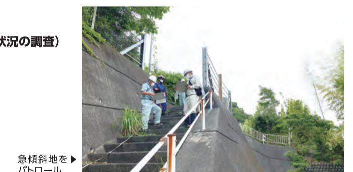
急傾斜地をパトロール