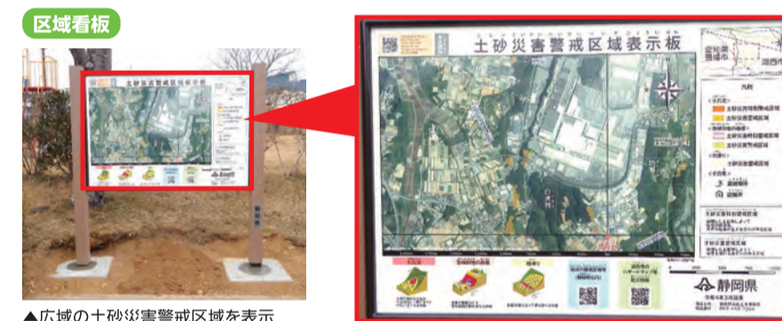
▲広域の土砂災害警戒区域を表示