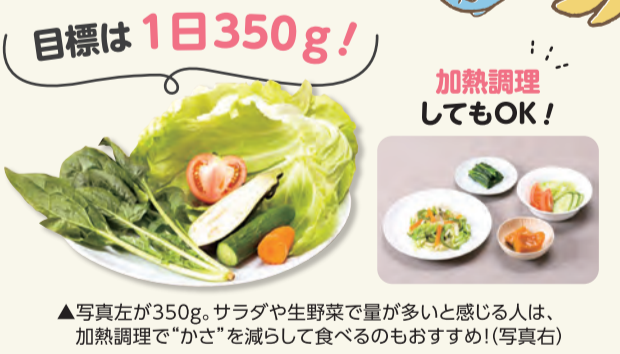
▲写真左が350g。サラダや生野菜で量が多いと感じる人は、加熱調理で“かさ”を減らして食べるのもおすすめ!(写真右)

ビタミン、ミネラル、食物繊維が豊富。たっぷり食べればいいこといっぱい! ・肥満防止、高血圧予防 ・脳卒中や心筋梗塞、胃がんのリスク減 など