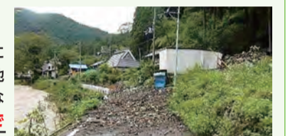
▲避難後に土石流で避難路がふさがってしまった

滋賀県長浜市 2020年7月 豪雨による土石流により避難路に隣接する倉庫1棟が被災したが、地区内の住民たちが自ら降雨状況などを確認し、事前に自主的な判断で避難所を開設。早めに避難ができ、人的被害を防ぐことができた。