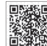
わたしの避難計画