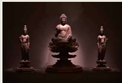
国重要文化財 阿弥陀如来及両脇侍像

仏像展示室の観覧料を無料とします。北条義時の父・時政が造らせたとされる阿弥陀三尊像等、24体の仏像を展示しています。(11月5日の9時～12時には朝市も開催します。)