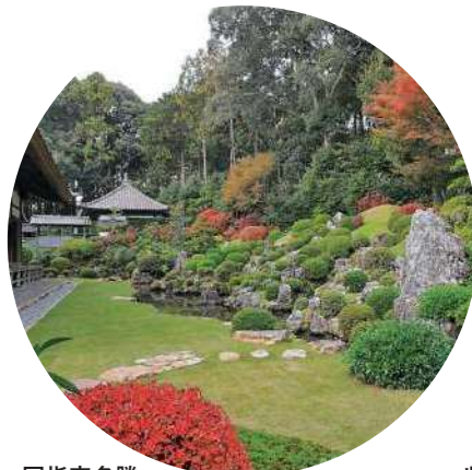
国指定名勝 龍潭寺庭園 浜松市