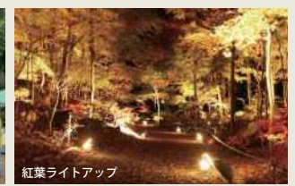
紅葉ライトアップ

日時 11月25日(土)、26日(日) 9時～16時 場所 秩父宮記念公園(御殿場市東田中1507-7) 問い合わせ 同上 ☎0550-82-5110 URL https://www.chichibunomiya.jp/