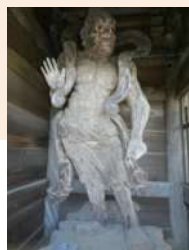
霊山寺 木造金剛力士立像(県指定)