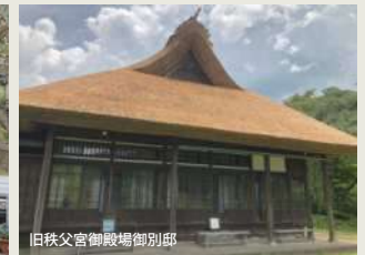
旧秩父宮御殿場御別邸

日時 10月21日(土) 9時～15時 場所 秩父宮記念公園(御殿場市東田中1507-7) 問い合わせ 同上 ☎0550-82-5110 URL https://www.chichibunomiya.jp/