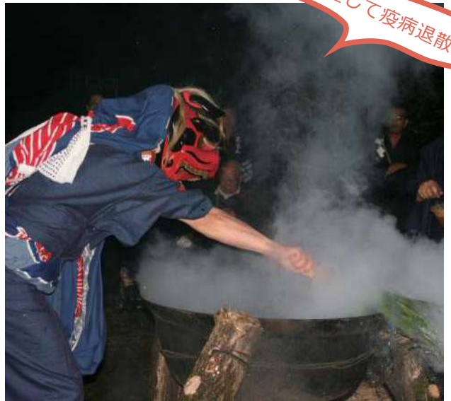
国重要無形民俗文化財