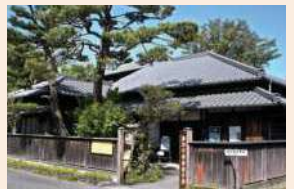
島田市博物館分館 (旧桜井家住宅主屋 (国登録))

両手で抱えられないほど大きな作品から手に乗る小さな作品まで、作風も異なる魅力満載の作品を一堂に展示します。 (一般 300 円、中学生以下無料、障害者及び介助者 1 名 (要手帳提示) は無料、11 月 3 日 (金祝) 無料)