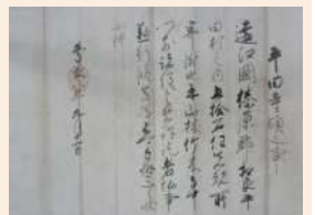
徳川家康朱印状 (平田寺所蔵) 10月29日まで展示

市内にある家康ゆかりの文化財を中心に、今川氏や武田氏の資料も公開します。また、相良油田や牧之原開拓など、徳川家の旧幕臣たちによる功績も紹介します。 (大人 220 円、小人 110 円)