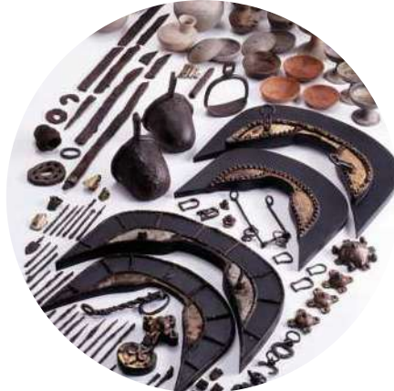
県指定有形文化財（考古資料） 原分古墳出土遺物一括 長泉町出土