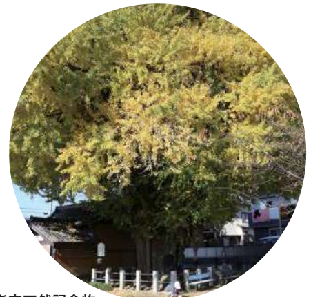
県指定天然記念物 富士岡地蔵堂のイチョウ 富士市