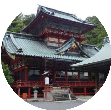
国重要文化財（建造物） 神部神社浅間神社拝殿 静岡市

( ) 国宝・特別史跡名勝天然記念物 令和5年5月1日現在 ≪静岡県内の指定等文化財件数≫