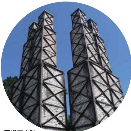
国指定史跡 葦山反射炉 伊豆の国市