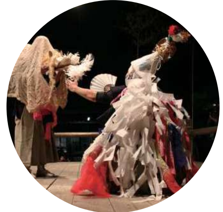
国重要無形民俗文化財 藤守の田遊び 焼津市