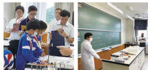
中学校での授業の様子