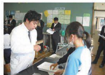
小学5年生での授業の様子

理科の授業を行うには、教材研究の時間だけでなく、薬品の調査や器具の準備・片付けなどにも多くの時間が必要となり、小学校の学級担任にとっては大変な作業となります。専科教員が小学校の理科を担当することで、それらの準備を効率よく進めることができます。また、学級担任にとっては専科教員が自分の学級の指導をしている間に児童の提出物を点検したり、事務仕事を進めたりすることができるため、学級担任の多忙化解消につながっています。