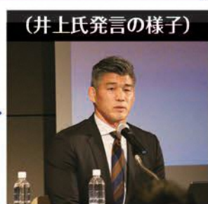
【スポーツコミッション担当室】

柔道に出会い、厳しさや礼節、相手への思いやり、感謝等を学び、人生が豊かになりました。勝つことによる自信、負ける悔しさ、努力が実らない現実などを乗り越え、レジリエンス能力が養われ、生き抜く力がつきました。