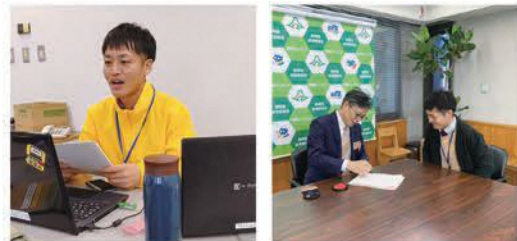
オンライン説明会で話している様子 規則改正の教育長決裁の様子

今年度は、より効率的な事務処理のために業務フローを見直して、必要な規則の改正も行いました。