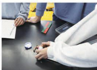
小学5年生での授業の様子

小学校の理科で学ぶ学習内容の多くは、中学校でその内容をより深く学ぶこととなります。例えば5年生の電磁石の学習では、電磁石のどこがN極、S極になるのかを方位磁針を使って調べます。一方で中学校では2年生で電磁石の周りに広がる磁界について、その広がり方を実験によって調べます。小学校で電磁石の実験をすると、「電磁石から少し離れた場所に方位磁針を置いたらどうなるかな」といった疑問が出ました。これは5年生の学習内容を越えた疑問ですが、中学校での学習につながる大切な疑問です。中学校での学習へのつながりを把握している専科教員だからこそ、こうした疑問を拾い、児童の学習をより深めることができます。