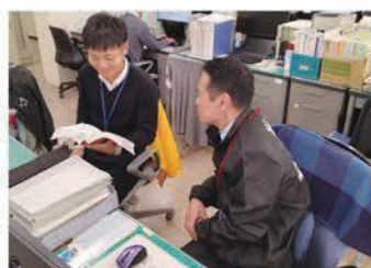
班長と協議中の様子

私は高等学校で14年間勤務し、教職大学院で1年間学んだ後に給与班に配属されました。事務職員経験が無かったため、給与班で交わされる用語、扱う条例・規則・通知の文言など、一切わからないところからのスタートでした。給与班には私以外に教員はいません。さらに、教員時代のように、児童生徒の教育活動に直接関わるような業務は全くありません。なぜ教員である私が給与業務をするのかと思いましたが、学校訪問で事務職員の方と話したり、日々の業務の中で、事務処理や学校への案内等を整理することで、業務の負担感が減り、給与支給ミスが減るのではないかと思い始めました。そこで、全く知識や先入観のない私が業務を見直してみることにこそ、教員が給与業務を担当することの意味があると考えました。