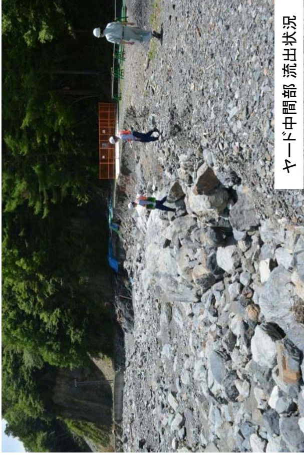
ヤード中間部 流出状況