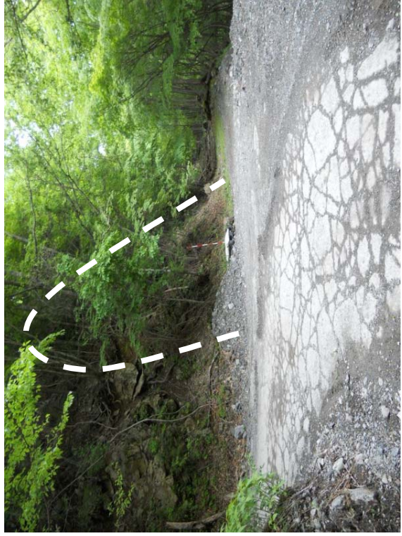
工事用トンネル計画位置