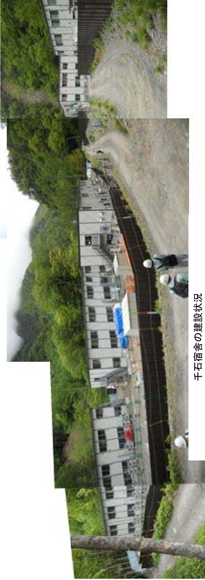
千石宿舎の建設状況