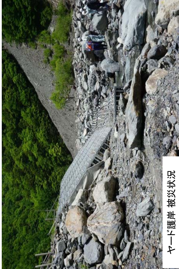
ヤード護岸 被災状況