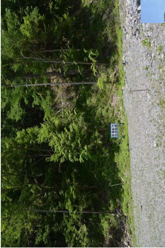
非常口トネル計画位置