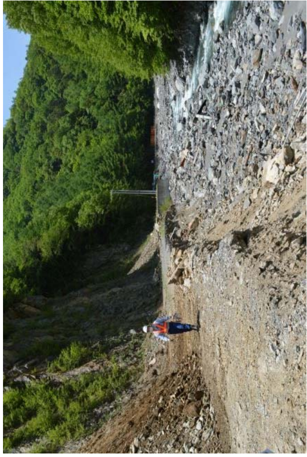
⑦ 西俣作業道の状況