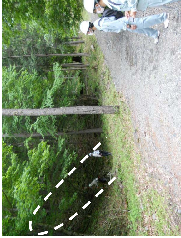
非常口トンネル(斜坑)計画位置