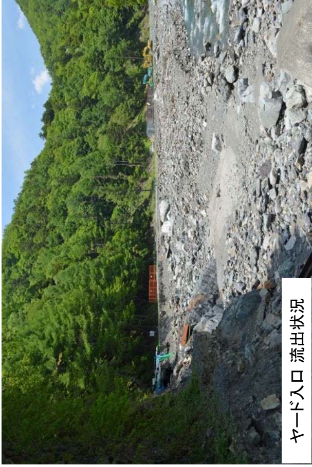
ヤード入口 流出状況