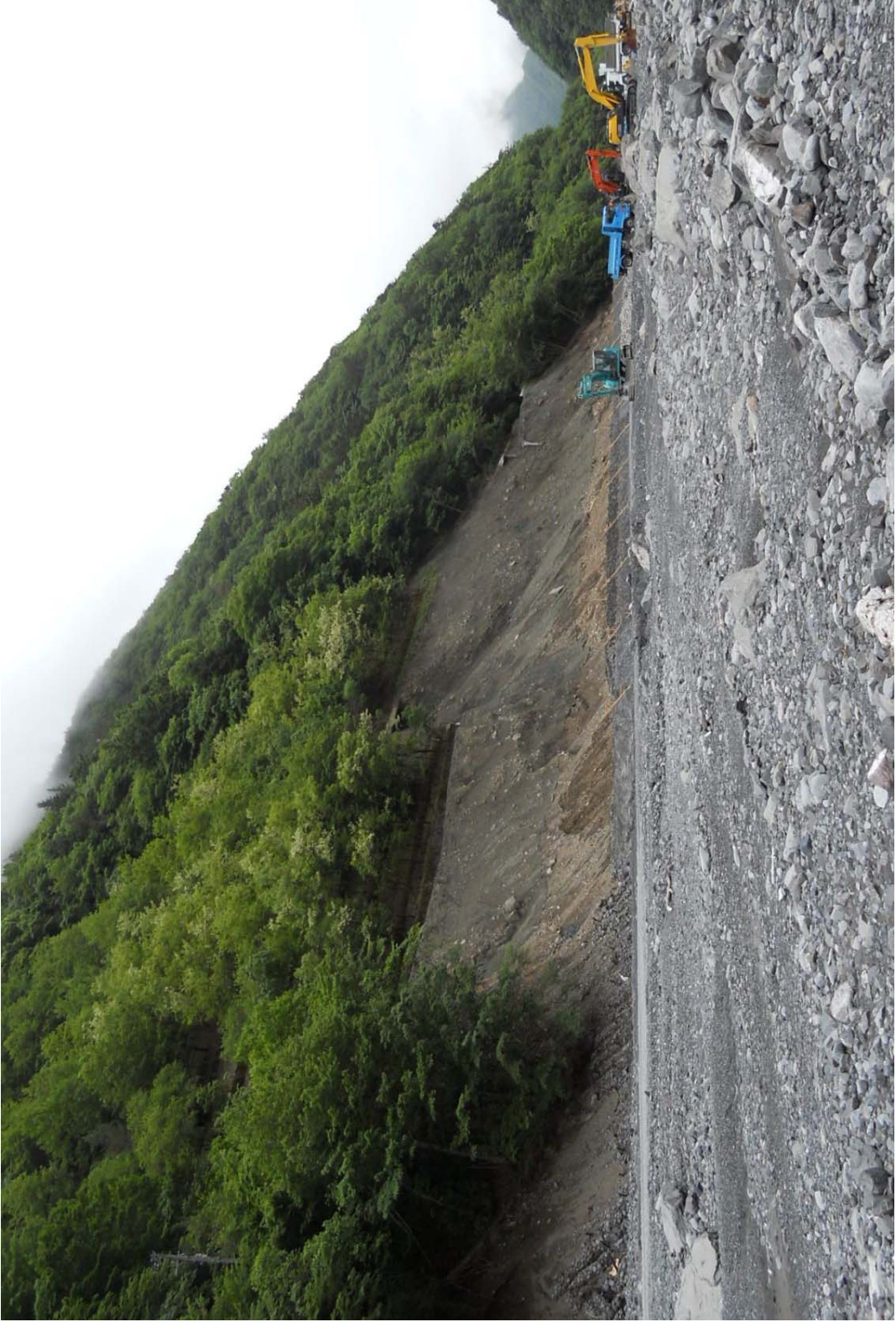
② 林道東保線 災害復旧状況