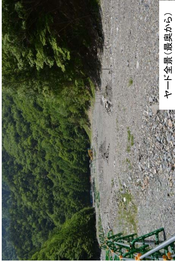
ヤード全景 (最奥から)