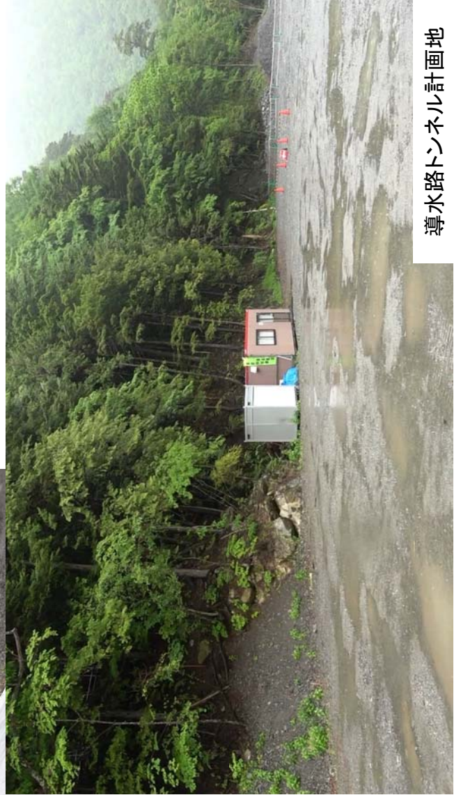
導水路トンネル計画地