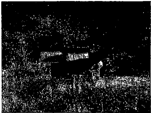
残土を運んできたトラック