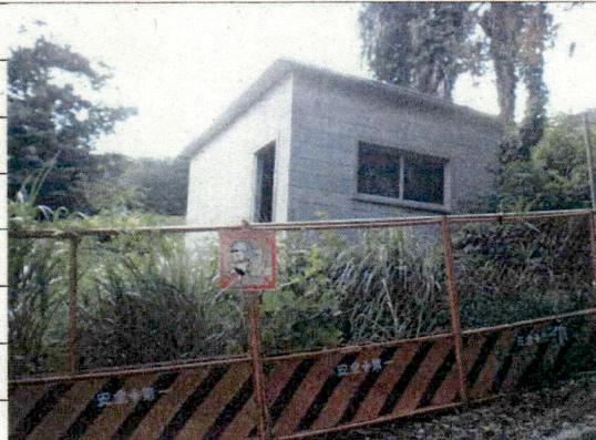
④ [Redacted] (熱海市日金町)