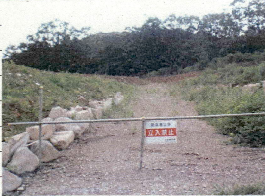
① [Redacted] (熱海市日金町)