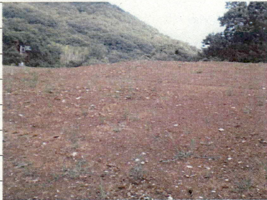
② [Redacted] (熱海市日金町)