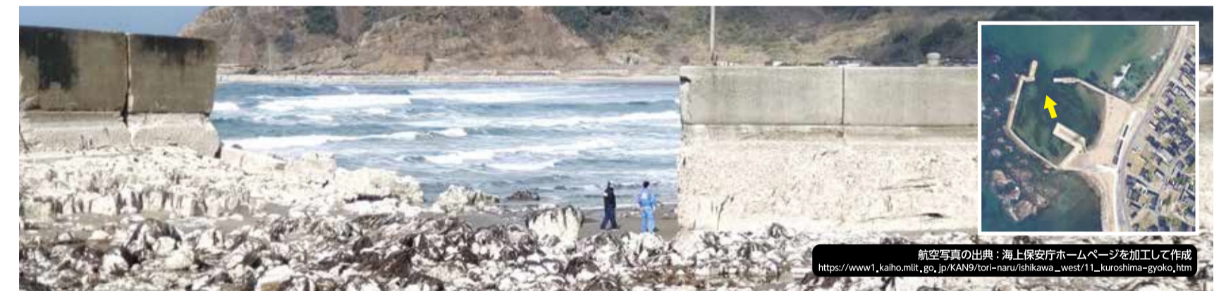
▲隆起し使えなくなった黒島漁港(輪島市門前町)

さらに、高齢化率の高い地域で、厳冬期の長期におよぶ避難生活は、被災者の健康を脅かしています。