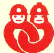
消防団協力事業所表示制度表示マーク

令和3年4月1日現在936事業所が県内市町の消防団協力事業所の認定を受けております。ぜひ、多くの事業所の皆様の参加をお待ちしています。