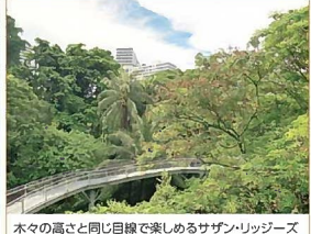
木々の高さと同じ目線で楽しめるサザン・リッジーズ