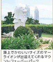
頂上でかわいいサイズのマールライオンが出迎えてくれるマウント・フェアパーク