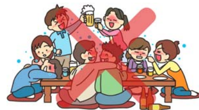
大人数の会食を避けてください