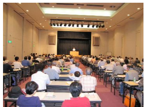
毎年6月に研修会を実施しています (写真は昨年度の様子)

また、年に一度研修会を開催しています。本年度は、新たに肝臓機能障害が追加された障害者手帳などの各種制度への習熟を図るほか、ロールプレイング研修を実施し、より身近で相談しやすい相談員を目指します。