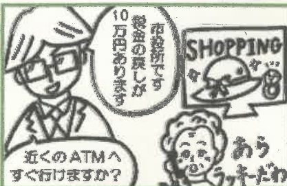
振込用のくたびれもつけ 通付金額 騙取 ~ 通付金詐欺 ~