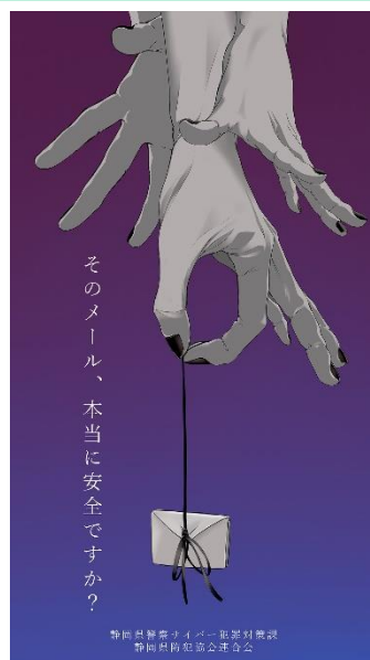
第2回デザイン部門最優秀作品